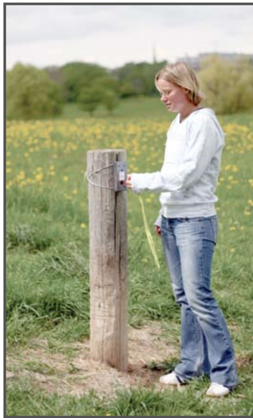
Registrering av chip vid checkpoint